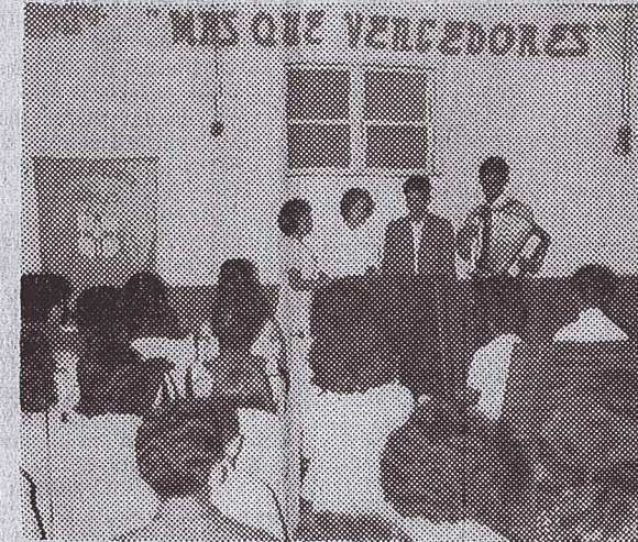
LA CUMBRE. — Uno de los actos llevados a cabo durante la última Convención Juvenil HH. MM.